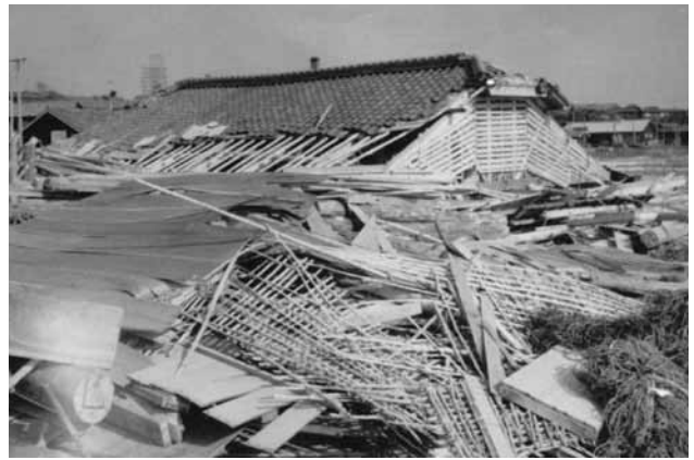
▲全壊した住宅。台風のすさまじさを物語っている。