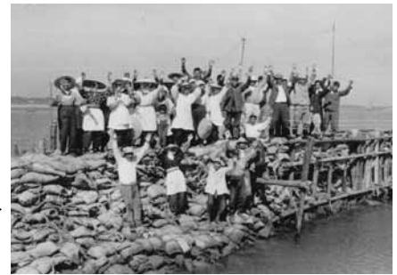
みおどめ 応急滞止工事完成のようす (服部新田)